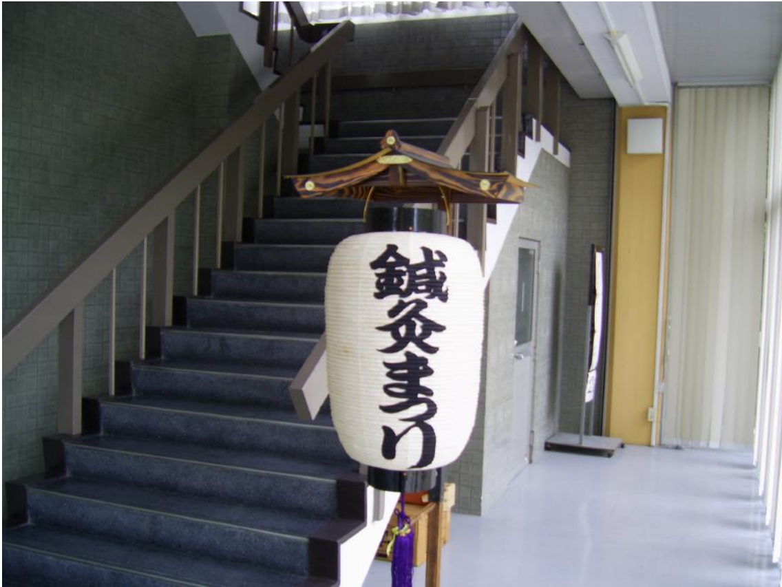
参集殿登り口には立派な提灯がお出迎え