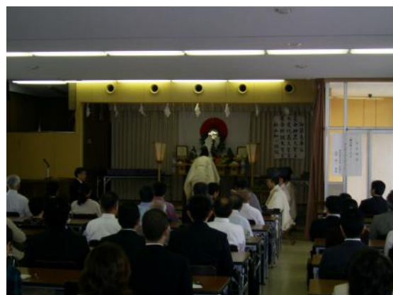
4人の神官による神事