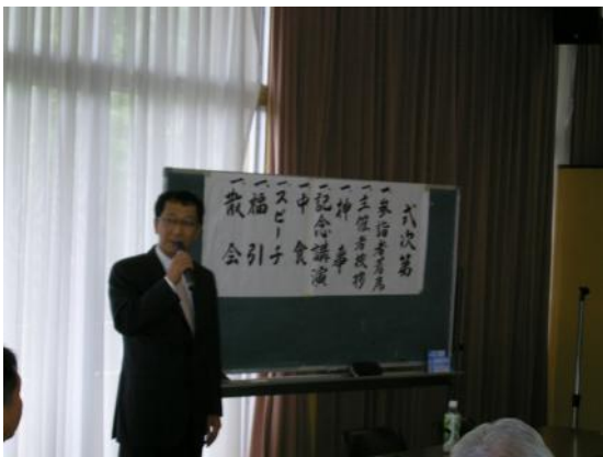
横山先生が司会です。