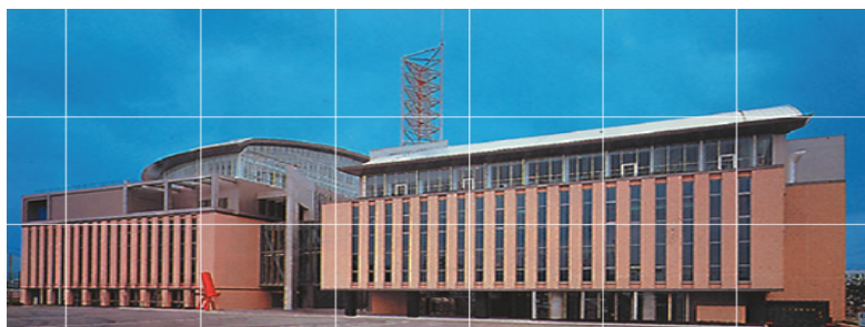
大会会場 京都テルサ